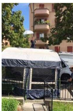
Dimensions : 6m/5m au sol, 3m de haut, prise électrique 230V 16A (prise ordinaire)

C'est pourquoi T-âtre s'est équipé d'une deuxième structure encore plus légère (montage en 1/2h et démontage en ½ heure) : un Camping-Car avec auvent, qui peut aussi servir de loge.